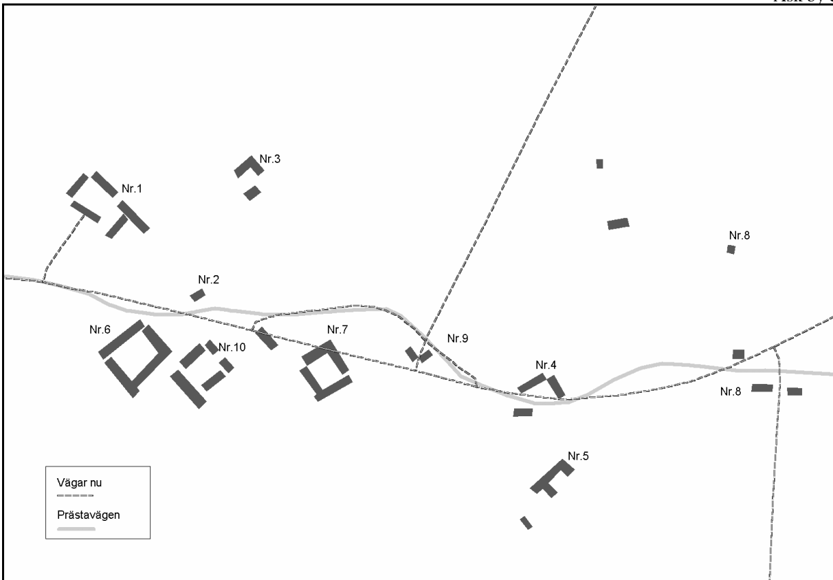
Sonnarp by ca 1830